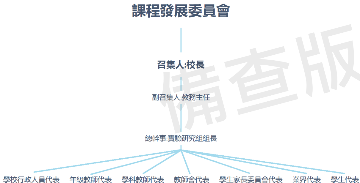
附圖1：香山高中課程發展委員會架構圖